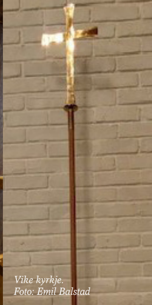
Vike kyrkje.