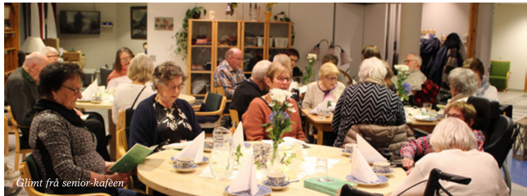
Glimt frå senior-kaféen