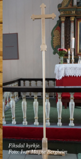
Fiksdal kyrkje.