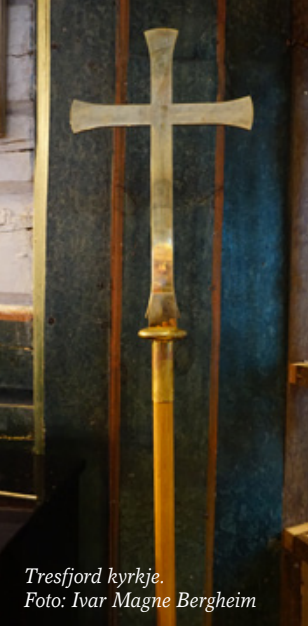
Tresfjord kyrkje.