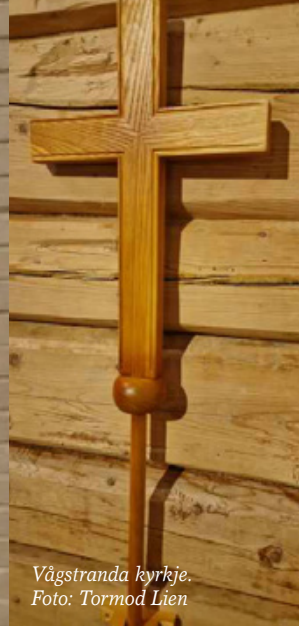
Vågstranda kyrkje.