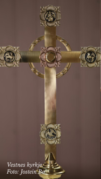
Vestnes kyrkje.