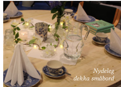
Nydeleg dekkja småbord

Så får vi sjå kven som blir invitert neste gong diakoniutvalet planlegg nytt arrangement.