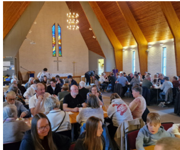
Potetball med mykje anna godt, samlar bygdefolk kvart år i Vike kyrkje.

Det er prisverdig at enkelte har vore med i over 15 år for å lage trivsel og hygge med smaken av potetball. Rundt 100 ball-etande bygdefolk møter fram i Vike kyrkje kvart år.